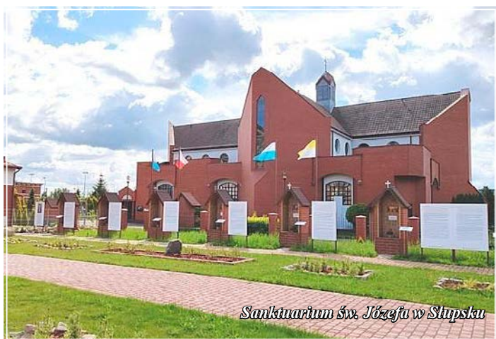
Sanktuarium św. Józefa w Słupsku

W sierpniu 1994 r., podczas uroczystej Mszy św. bp ordynariusz poświęcił wizerunek św. Józefa i przekazał go pierwszej rodzinie, inaugurując peregrynację obrazu. Poświęcenie kościoła nastąpiło w 2001 r. Świątynia ma bardzo nowoczesną formę, zarówno zewnętrzną, jak i wewnętrzną (zachęcamy do odwiedzenia strony internetowej sanktuarium).