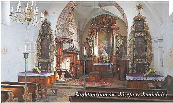
Sanktuarium św. Józefa w Jemielnicy