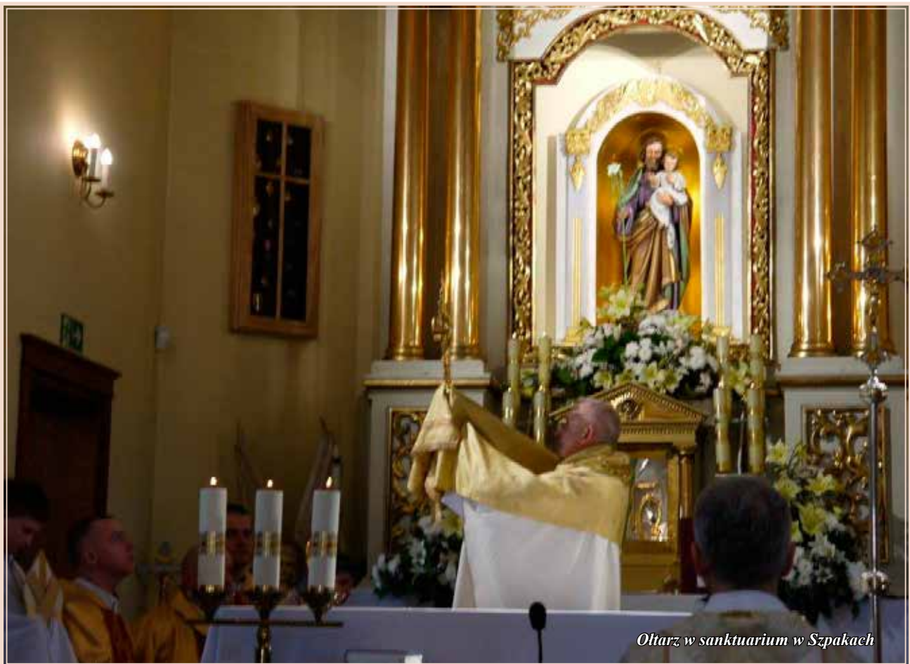
Ołtarz w sanktuarium w Szpakach

w bitwie pod Wielkimi Łukami w 1580 r. W późniejszym czasie miejscowość była częściowo zasiedlona przez tak zwanych sołtysów łanowych z nadania Jana III Sobieskiego, potwierdzonego przez Sasów (do dzisiaj część tutejszych pól nazywana jest „sołtyskie”).