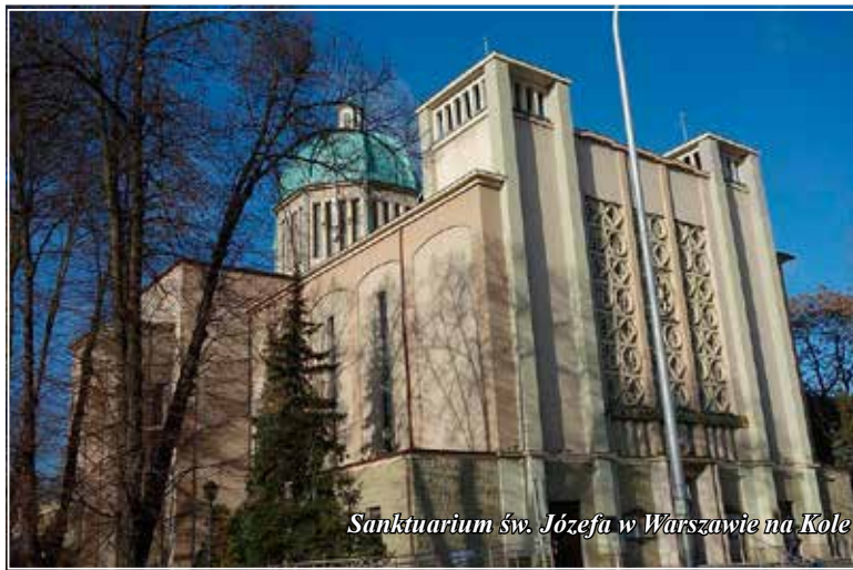
Sanktuarium św. Józefa w Warszawie na Kole

ich osiem w ośmiu ośrodkach całodobowej adoracji w Polsce. Po znacznym spadku liczby pełniących dyżury adoracyjne od roku 2020 następuje wymiana pokoleniowa i wyraźnie zwiększa się krąg adorujących Najświętszy Sakrament.