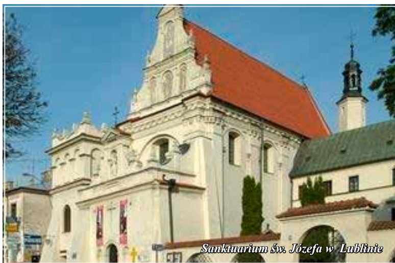
Sanktuarium św. Józefa w Lublinie

wykonany z metalowych liter napis „Pójdźcie do mnie wszyscy”. Dębowe okute blachą drzwi dzielące nawę od kruchty kościelnej zastąpiono dwuskrzydłową żelazną kratą z monogramami Imienia Maryi pośrodku. dzięki temu ludzie wchodzący do kościoła mogą, pomimo zamkniętej kraty, adorować Najświętszy Sakrament.