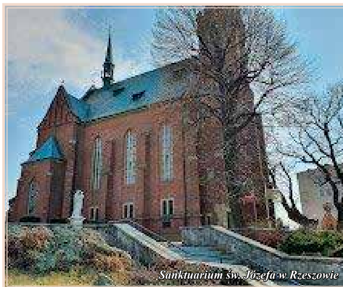
Sanktuarium św. Józefa w Rzeszowie

Witraże zostały częściowo uszkodzone dwukrotnie: najpierw w maju 1915 r., podczas wysadzania mostu na Wisłoku przez Moskali, a potem, w lipcu 1923 r., gdy wybuchła rzeszowska prochownia. Prace przy ich odbudowie prowadziła firma z Krakowa.