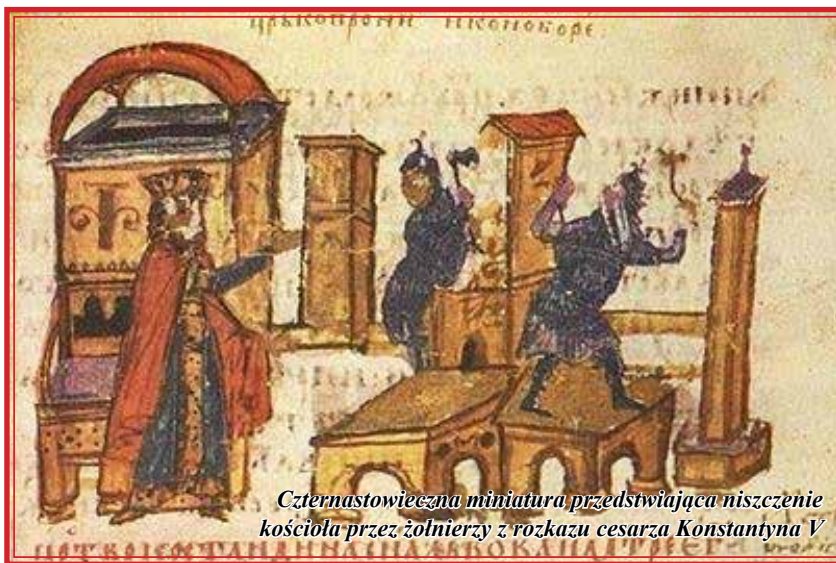
Czternastowieczna miniatura przedstawiająca niszczenie kościoła przez żołnierzy z rozkazu cesarza Konstantyna V

tęgo, co jest w wodach pod ziemią! Nie będziesz oddawał im pokłonu i nie będziesz im służył. Zakaz jest jednoznaczny. Tymczasem człowiek nosi w sobie naturalną dążność do przybliżenia tego, czego zobaczyć nie może, na przykład Boga, który jest bytem niematerialnym, a więc niedostępnym oglądowi za pomocą zmysłów. Sięga zatem w tym pragnieniu przybliżenia sobie Stwórcy do wyobrażeń obrazowych – maluje obrazy, wykuwa rzeźby i umieszcza je w miejscach uznanych za godne tych ikon i rzeźb. Zatem narzuca się nieodparcie pytanie: malując obraz Chrystusa łamie twórca tego obrazu przytoczony wyżej zakaz, czy nie łamie?