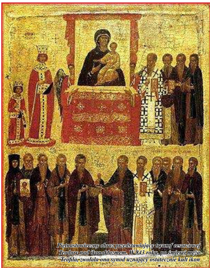
Piętnastowieczny obraz przedstawiający tryumf cesarzowej Teodory nad ikonoklazmem. W 843 roku, po śmierci męża Teofila, zwołała ona synod uznający ostatecznie kult ikon

nują, i ci, którzy im oddają cześć, zasługują na potępienie. Wtedy ze strony tych osób zrodził się sprzeciw. Sobór zwołany do Nicei w 787 roku orzekł, że obraz ma rację bytu, ponieważ Bóg w Chrystusie stał się widzialny – św. Paweł mówi, że Chrystus jest obrazem