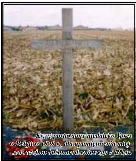
Krzyż postawiony niedaleko Ypres w Belgii w 1999 r., dla upamiętnienia międzyrozejmu bożonarodzeniowego z 1914r.

Boże Narodzenie, ponad sto lat temu, połączyło ludzi, którzy byli sobie wrody tak bardzo, że gładzili siebie nawzajem