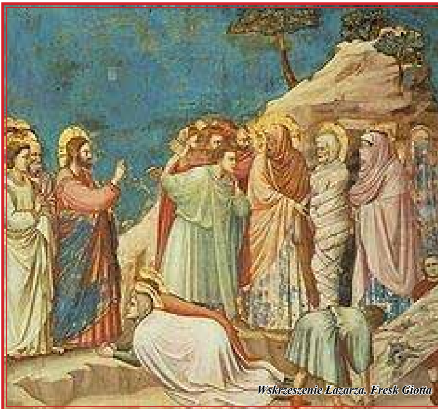
Wskrzeszenie Łazarza. Fresk Giotto

C złowiek współczesny lubi dowody, twarde dowody. Być może jest to efektem wdzierania się do naszej społecznej świadomości elementów kultury są-