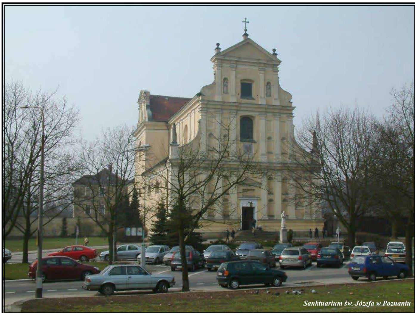
Sanktuarium św. Józefa w Poznaniu

Po 14 latach, w roku 1635, rozpoczęto budowę kościoła murowanego. Trwała ona przeszło 50 lat, z kilkukrotnymi przerwami spowodowanymi potopem szwedzkim. W dodatku najeźdźcy spalili kościół w Wielki Piątek 1656 r. W rok później, po wycofaniu się wojsk Karola Gustawa, miasto odwiedził król Jan Kazimierz. Gdy zobaczył zgliszcza kościoła i zwaliska klasztoru oraz zbudowane do połowy mury nowej świątyni i domu zakonnego - kazał wydać przywilej na wyrąb drzew w lasach królewskich, aby dachem przykryć nowy kościół