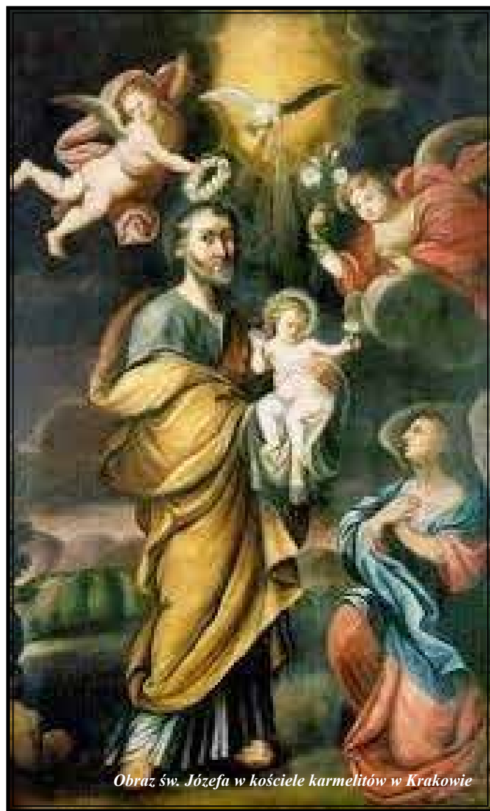
Obraz św. Józefa w kościele karmelitów w Krakowie

W Krakowie od połowy XVII wieku istniały dwa ośrodki kultu świętego Józefa. Były to znajdujące się na Starym Mieście, przy obecnej ulicy Poselskiej (któ-