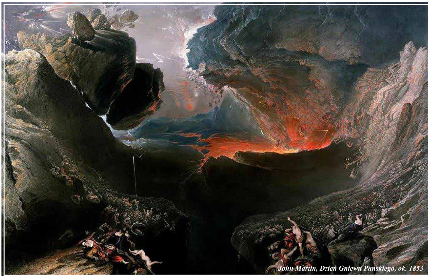
John Martin, Dzień Gniewu Pańskiego, ok. 1853

oczekiwaniom biskupa z Hippony, świat nie zmierzał ku Królestwu Bożemu. Wojny, nieszczęścia towarzyszące upadkowi Rzymu pod ciosami barbarzyńców, nędza zniewolonych i biednych zdawały się potwierdzać siłę Zła. Już św. Grzegorz Wielki, biskup Rzymu i papież na przełomie V i VI wieku ostrzegał, że stan ówczesnego „świata nie tylko zapowiada jego koniec, ale bezpośrednio nań wskazuje”. Zatem już wtedy pełne nadziei i radosne oczekiwanie na powtórne przyjscie Chrystusa – tak charakterystyczne dla chrześcijan pierwszych wieków, oczekujących rychłego odkupienia, przekształcało się w trwożną obawę przed Dniem gniewu Pańskiego. I tak kojarzyła się Paruzja najczęściej w powszechnej pobożności przez całe wieki, aż po czasy współczesne. Starsi ludzie dobrze pamiętają obrazy wywoływane w ich wyobraźni przez kaznodziejów mówiących o końcu świata, Sądzie Ostatecznym. W tych obrazach dominowały lęk i trwoga.