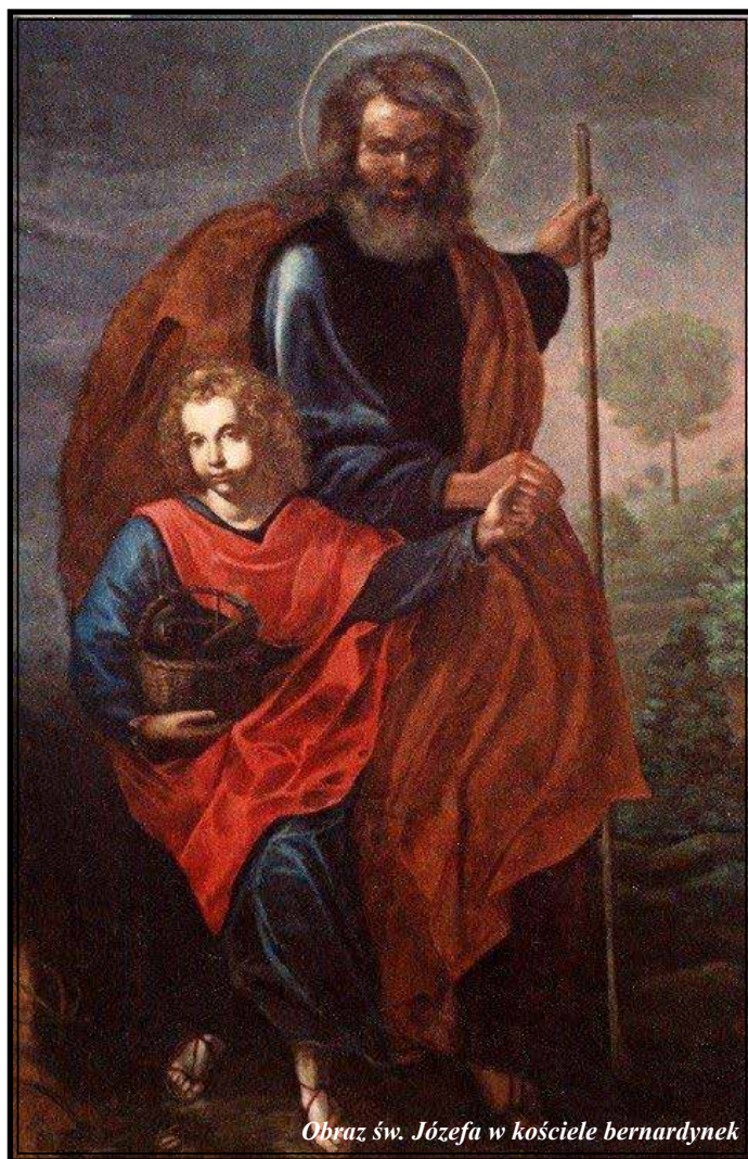
Obraz św. Józefa w kościele bernardynek

dłoni trzyma mały kolisty wiklinowy koszyczek zawierający narzędzia ciesielskie, zaś lewą ujmując dłoń świętego Józefa. Obie postacie kroczą na tle pejzażu. Cała kompozycja tchnie ciszą, a jednocześnie stłumionym napięciem. Św. Józef wyraźnym gestem i z zatroskaną twarzą kieruje w prawo młodocianego Jezusa, który podążając lekkim krokiem ze swym Opiekunem, jednocześnie zwraca się ku lewej stronie, patrząc poważnie przed siebie. Chłopięcy Chrystus pragnie iść własną drogą, inną niż wskazuje święty Józef, świadomy swego posłannictwa. Sytuację tę potęguje kontrast jasnej twarzy Jezusa i ciemnego oblicza świętego Józefa. Cechy formalno-stylistyczne wskazują na manierystyczny charakter i miejsce powstania: północne Włochy, ale nie jest znany jego autor.